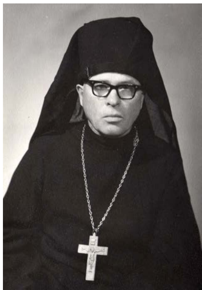
Ako vysvätený ihumen

в с. Доробратово. 10 вересня 1950 р. священник звернувся до Патріарха Московського Алексія з листом, у якому просив прийняти його слухачем Московської духовної академії. Однак прохання ієромонаха Іустина залишилося поза увагою 30 . До Різдва Христового 1951 р. з благословення єпископа Іларіона (Кочергіна) ієромонаха Іустина (Сідака) було нагороджено набедреником.