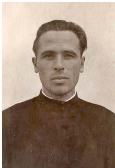
Po zložení mníšskych sľubov

рені чоловічі і жіночі монастирі в Ізі, Липчі, Терблі. Після єпископа Досифея «Карпаторуською православною церквою» керували єпископ Новосадський Іринея (Чирич) 2 , Призренський Серафим (Іованович) 3 та Бітольський Йосип (Цвійович) 4 .