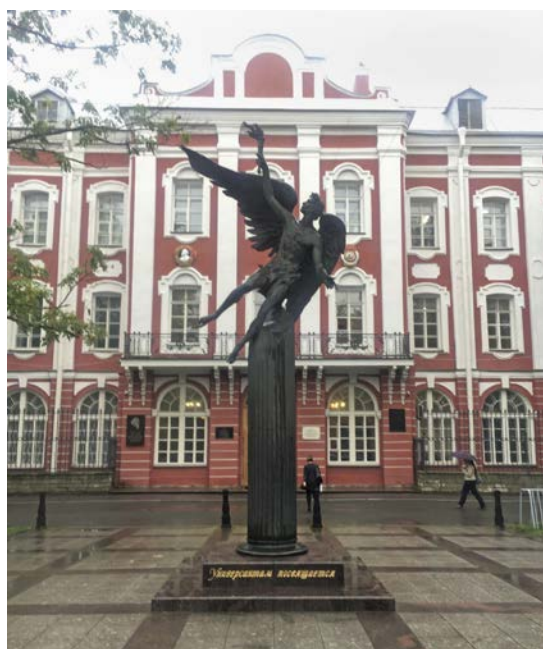
Sankt-Peterburgská štátna univerzita.