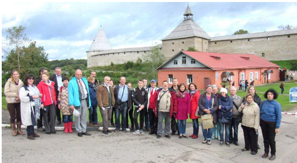
Účastníci kongresu na druhom výjazdovom seminári v Starej Lagode

medzinárodného kongresu, nasmeroval kroky historikov do Štátneho múzea v Starej Lagode, ktorá sa nachádza cca 200 km od Sankt Peterburgu.