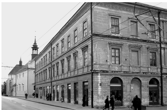
Prešovské evanjelické kolégium

že sa potvrdili jeho počiatočné obavy z reakcie maďarskej strany. Predstavil svoj názor na existenciu samostatnosti slovenského národa, opätovne zdôrazňujúc, že je potrebné „oživovať a brániť ju, so všetkými možnými, ústavou dovolenými predstavami do života uvádzať práva národnosti našej slovenskej, ale pritom pevne držať s uhorskou stranou oproti centralistickej nemeckej, so zadržaním si práva, napokon, čo nám ešte chýba je solidárne so všetkými uhorskými a rakúskymi Slovanmi ju vymáhať“. 11 Stanovisko zaujal k slovanskej vzájomnosti, ktoré prezentoval aj na pôde Novej školy. Vnímal ju vo federalizačnej podobe, v slobodnom spájaní slovanských národov, odmietajúc však centralizáciu, t. j. spájanie slovanských národov pod nadvládou jedného národa, aj keď išlo o najväčšie slovanské národy – Poliakov a Rusov. 12