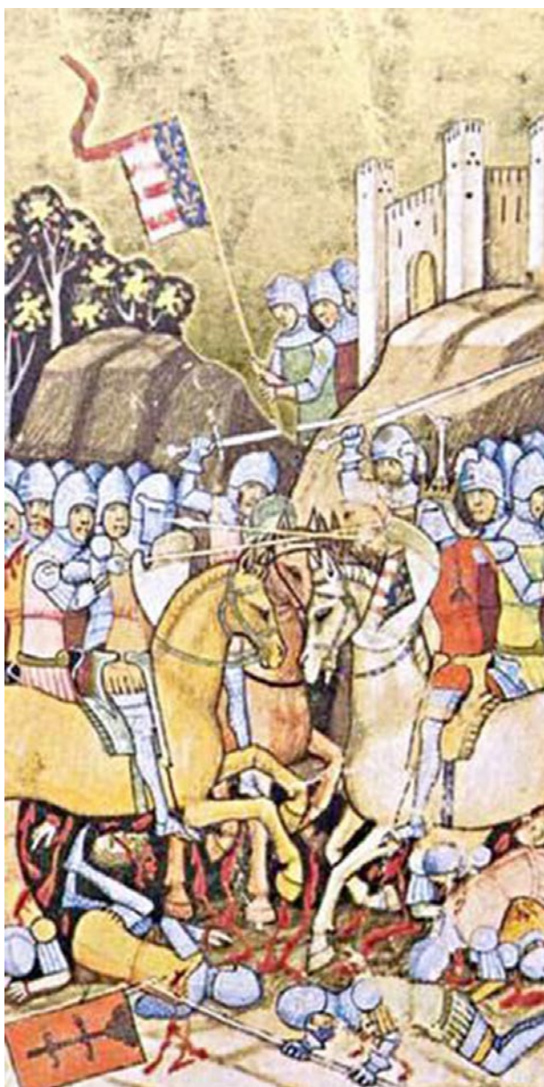
Bitka pri Rozhanovciach podľa Obrázkovej kroniky.

Keďže doklady o platbe v zlate za držbu pozemkov pochádzajú z obdobia po mongolskom vpáde, prví po mene známi vlastníci Vyšných Košíc sa mohli dostať k príslušnému majetku až v tom čase, teda pomerne nedávno predtým, ako ho aj stratili. Naznačujú to tiež pozostatky mohutného, nikdy však nedostavaného hradu, ktoré sa nachádzajú na jednom vrchu niekdajšieho vyšnokošického teritória, zvaného do súčasnosti Hradová. Žiadne pramene nespomínajú tento hrad ako funkčný, 28 zostal po ňom len názov hradného kopca, čo poukazuje na výstavbu ešte v období predchádzajúcom vzrastu spísomňovania. V historiografii sa dlho usudzovalo, že hrad dal vybudovať oligarcha Omodej Aba na začiatku 14. storočia, aby odtiaľ kontroloval blízke mesto Košice a okolie, 29 prípadne, že hrad mal ešte včasnostredoveké počiatky s funkciou hradiska. 30 No nedávnym archeologickým prieskumom sa jednak nepotvrdila teória o starodávnejšom pôvode hradu, jednak sa preukázal mi-