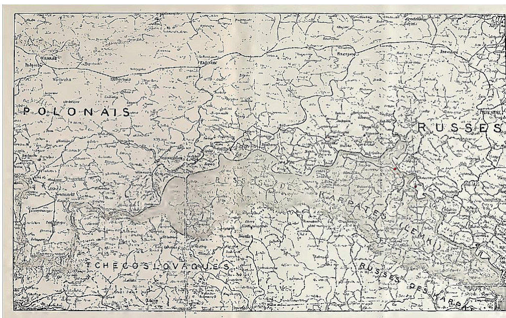
Mapa územia obývaného Lemkami na severných svahoch Karpát

rigovali svoje politické požiadavky. Okrem praktického významu mala Beskidova účasť v Paríži aj symbolický význam v tom zmysle, že Rusíni skutočne chcú patriť do Česko-Slovenska. 20 Predstavitelia ruskej komisie sa prostredníctvom Eduarda Beneša stretli s predstaviteľmi americkej a francúzskej delegácie – plukovníkom Edwardom Mandellom Houseom 17. februára a André Tardieuom 24. februára. Pred oboma diplomatmi vyjadrili pranie začleniť Rusínmi obývané územie do Česko-Slovenska. 21 Dňa 28. februára sa česko-slovenská komisia zaoberala touto otázkou. Proti pripojeniu Rusínov k Československu vystúpili iba Taliani, ktorí obhajovali ich zotrvanie v Maďarsku. Po diskusii však bola nakoniec akceptovaná česko-slovenská alternatíva, a to po argumentácii, že tak chcú nielen česko-slovenskí predstavitelia, ale aj samotní Rusíni. 22