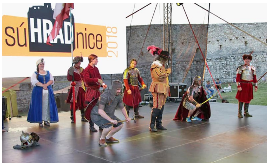
Súhradnice 2018.

celkom pod záštitou UNESCO. Samotnú výstavu navštívilo až 80 000 návštevníkov. Úspech tejto výstavy bol inšpiráciou pre vytvorenie samostatnej expozície venovanej Majstrovi Pavlovi z Levoče. 15 Samotný Majster Pavol a jeho záhadný život je dodnes vďačnou témou, obľúbenou nielen u levočskej verejnosti. V roku 2017 bola zrealizovaná výstava s názvom Majster Pavol z Levoče. Ruky a zlato v službách ducha . Bola voľným pokračovaním výstavy L' ARTE DEL TARDO GOTICO MEDIOEVALE IN SLOVACCHIA (Poklady gotiky na Slovensku. Umenie neskorého stredoveku na Slovensku.) Táto výstava bola prezentovaná v sídle talianskych prezidentov v Kvirinálskom paláci v Ríme. Bola usporiadaná v rámci predsedníctva Slovenskej republiky v Rade Európy v druhom polroku 2016. Pre veľký úspech výstava, s podporou Ministerstva kultúry SR a s nemalou zásluhou Spišského múzea v Levoči, pokračovala v priestoroch Historického múzea v Bratislave. Nemenej úspešné boli aj iné projekty, ktoré nepresiahli hranice Slovenska. K takým patrí zrealizovaný projekt Terra Scepusiensis – Terra Chriastiana 1209 – 2009 , za ktorú získalo múzeum výročnú cenu časopisu Pamiatky a múzea za rok 2009 v kategórii výstava. Túto cenu získalo Spišské múzeum v Levoči aj nasledujúci rok, za výstavu Levočská Biela Pani .