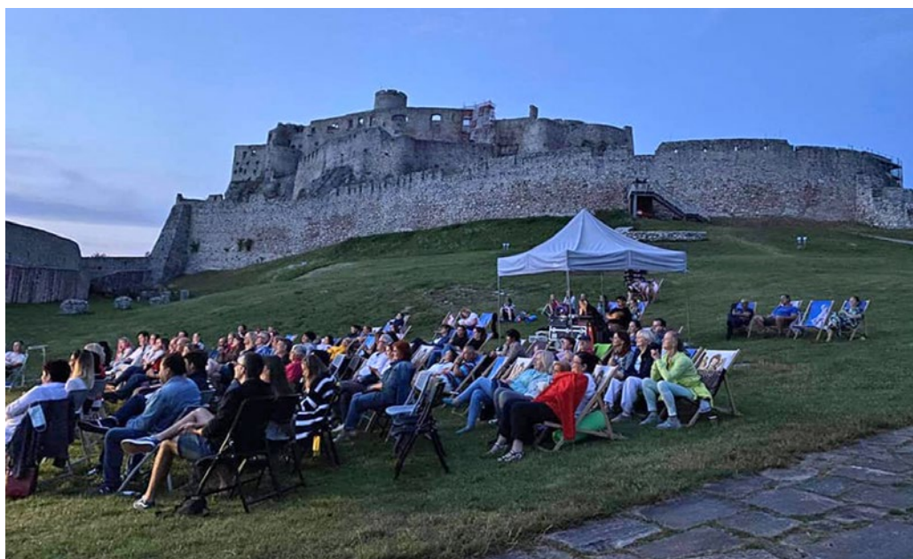
Divadelný večer na Spišskom hrade.