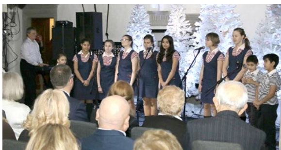
Museum Charity Night