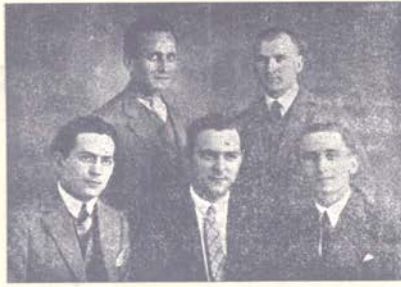
KARPATOROSSY NA STUDIJACH.

Sej novyj sposob železnodoroškoje gospodarstva, kotoryj uže ot počatku (postrojka nastojalščej železnodoroški — 16 km. — stojila 2 i pul miliona Kč) tak mnohim dala žičje i pracju, svidomišju časť naroda ža-