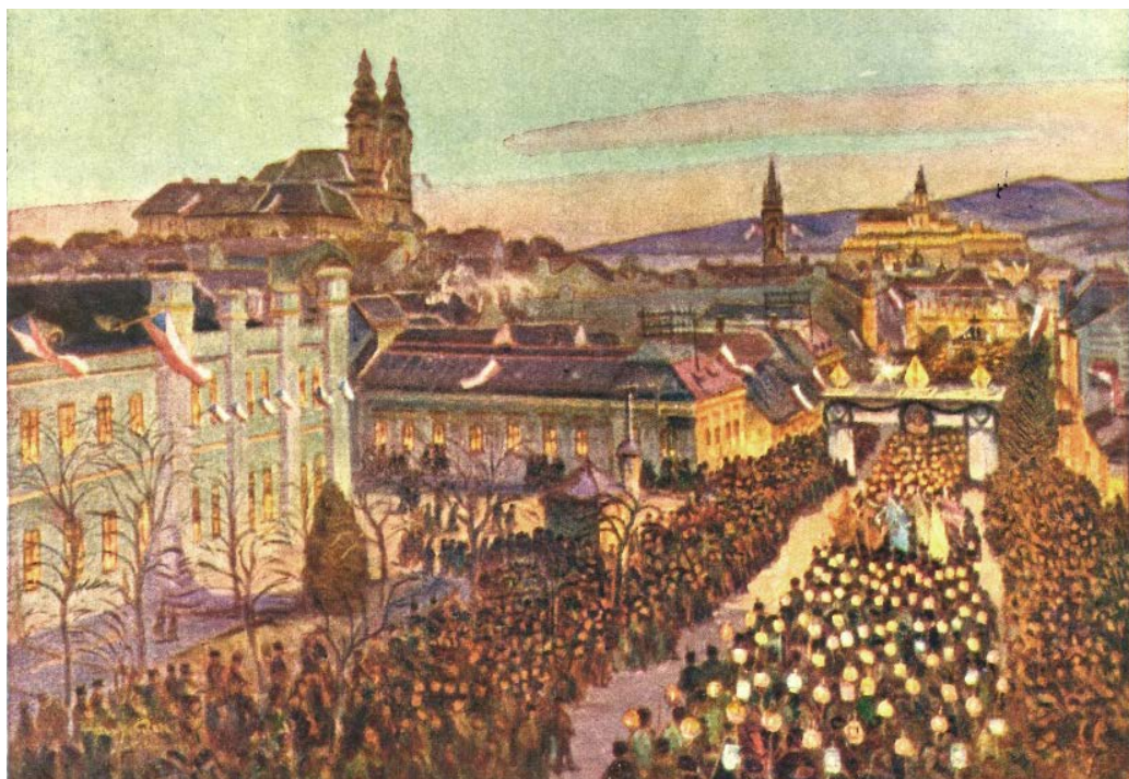
Ukážka z vysviacky – pochodňový sprievod v Nitre. 15