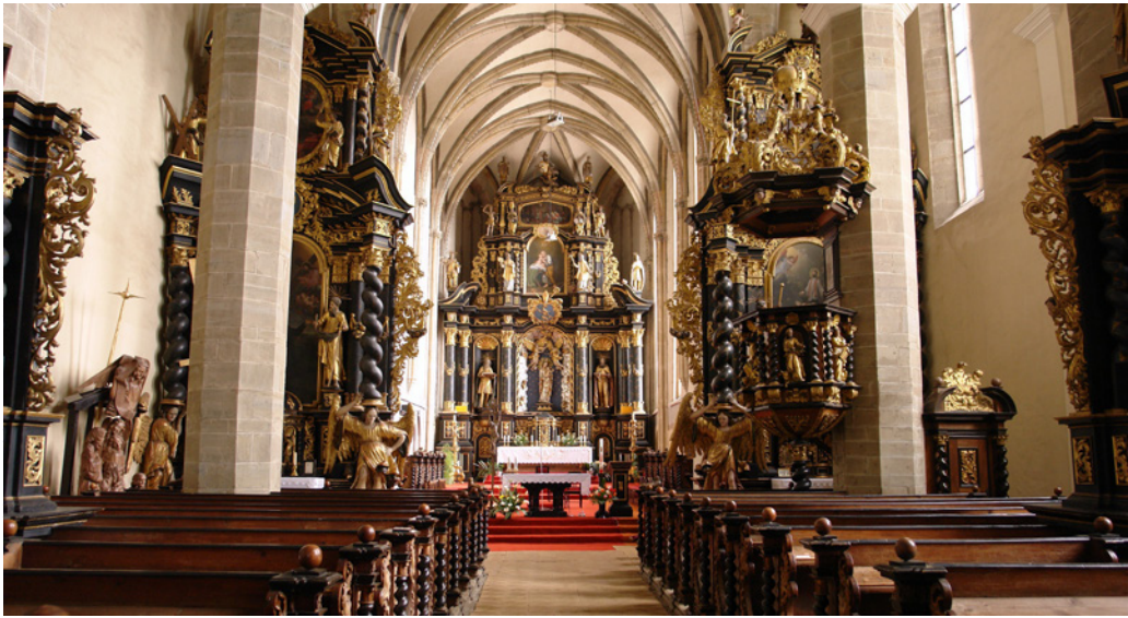
Interiér Kostola sv. Ladislava, tzv. Čierny kostol.

minulosť, prítomnosť aj budúcnosť. „Nová“ zbierka, vytvorená v roku 2008 pomocou súčasných technológií v sebe ukrýva symbol, ktorý sa dejinami traduje v rôznych kultúrach od staroveku. Je to aj téma františkánska, pretože autorom jedného zo základných diel pre dobu vrcholného stredoveku bol františkán sv. Bonaventúra z Bagnoregia, ktorý okolo roku 1260 vytvoril spis Strom života .