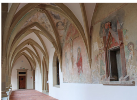
Ambit s nástennými maľbami.