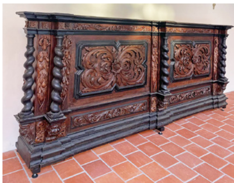
Lavica inštalovaná v ambite.