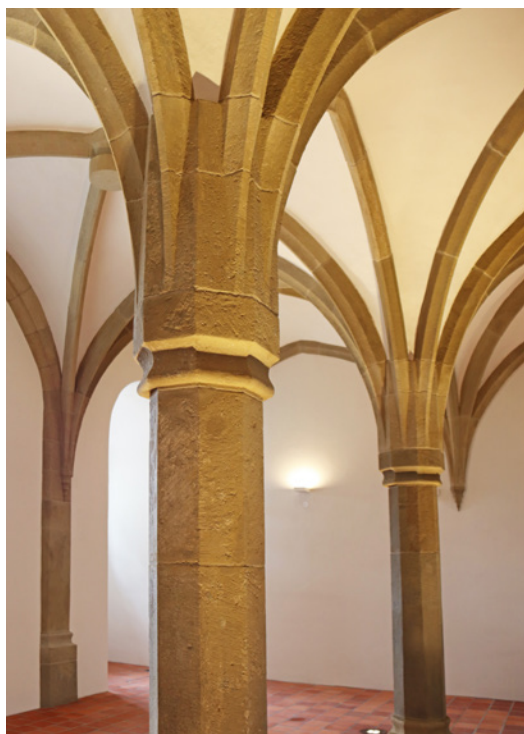
Refektár.