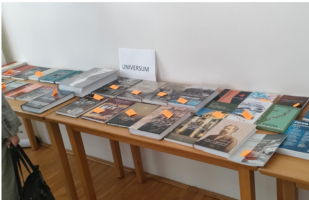
Z výstavy kníh.