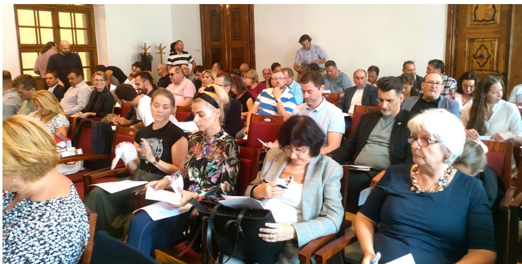
Valné zhromaždenie SHS – voľba nového výboru SHS a SNKH.

Vyvrcholením 16. zjazdu SHS bolo jej valné zhromaždenie, ktoré sa konalo v dopoludňajších hodinách 8. septembra 2022. Ako prvá odznela správa o činnosti SHS, ktorú predniesol predseda SHS Rastislav Kožiak. Nebola to klasická enumerácia