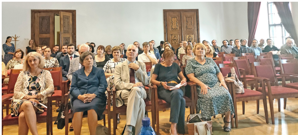
Pohľad na účastníkov 16. zjazdu SHS.

sa už dlho javili ako čosi, čo ostalo len dramatickým prvkom v dejinách, o čom sa píše v historických prácach, ale čo sa modernej spoločnosti netýka. Život však ukázal, že je v mnohom nevyspytateľný a pred ľudstvom vždy vznikajú náhle výzvy,