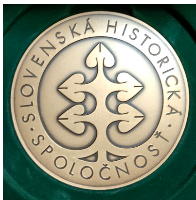
Plaketa Slovenskej historickej spoločnosti pri SAV