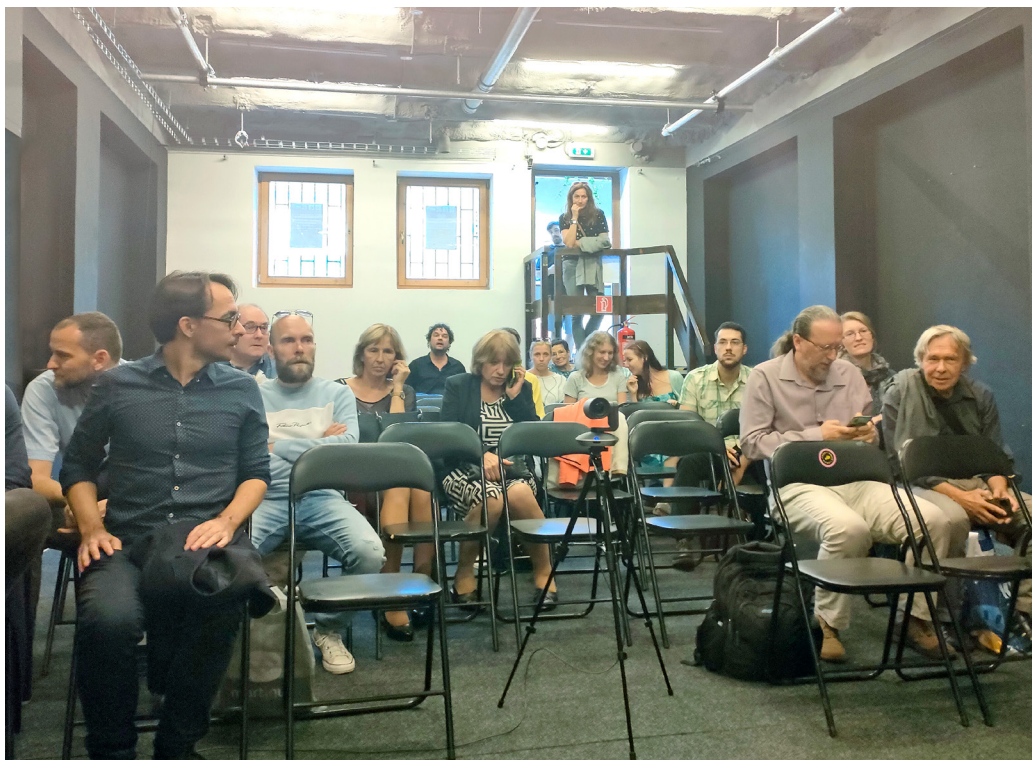
Účastníci besedy s vydavateľmi historickej literatúry