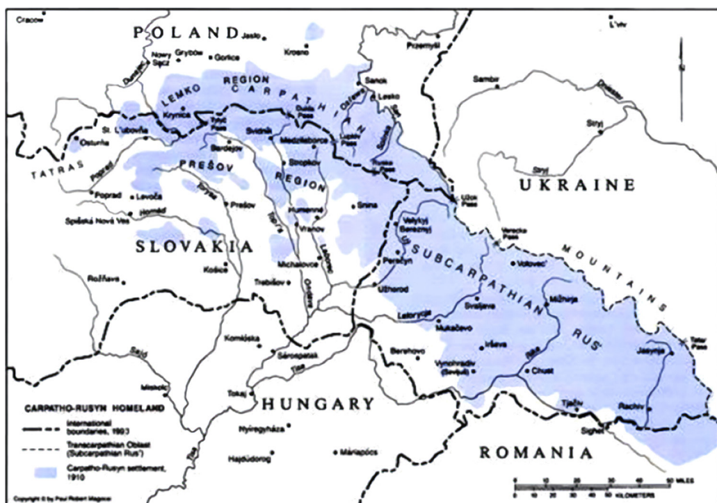
Migrácia valašského obyvateľstva do oblasti Karpát.

na produkciu mlieka a výrobu syra. S kolonizáciou na valašskom práve súvisí aj udomácnenie nového druhu oviec, ktorý bol vhodný pre chov v nepriaznivejších klimatických podmienkach. Okrem ovčiarstva sa toto obyvateľstvo zaoberalo aj pestovaním poľnohospodárskych plodín na horských poliach, uhliarstvom v okolí bankských miest a tiež ťažbou a spracovaním dreva. 5 Rusínske obyvateľstvo sa vo vzťahu k domácejmu obyvateľstvu vymedzovalo dvoma základnými znakmi, ktorými boli odlišná (nepôvodná) etnicita a príslušnosť k východnému kresťanskému obradu. 6 Od domáceho obyvateľstva sa odlišovalo svojráznymi životnými podmienkami, ktoré vyplývali predovšetkým z jeho pastiersko-dobytkárskeho zamestnania. Tieto okolnosti, ktoré boli posilnené (pred)uhorskými tradíciami sa stali základom osobitosti právneho postavenia Valachov. 7