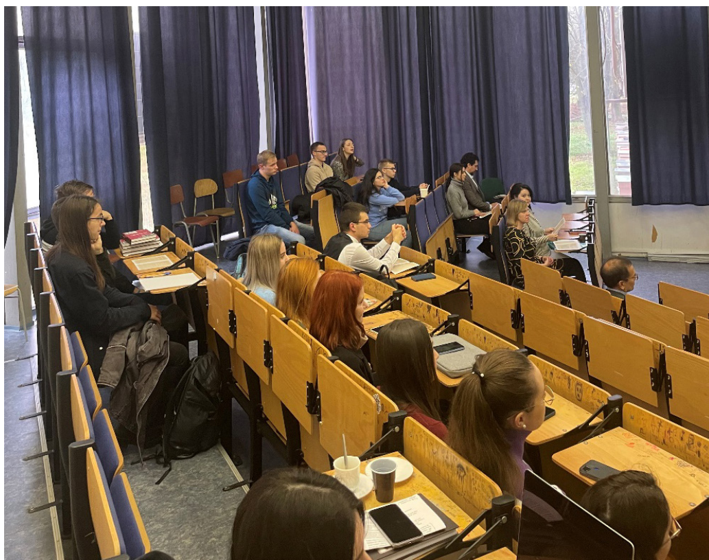
Účastníci Medzinárodnej vedeckej konferencie „Významné medzníky v dejinách strednej Európy v ranom novoveku“.

prezentovaným témam, patril príspevok dr. B. Akina „ Moháč v osmansko-tureckých prameňoch “. Jeden z kľúčových momentov, resp. jednu z významných udalostí dejín strednej Európy tak prítomní mali možnosť sledovať z pohľadu u nás stále iba málo známych prameňov. K rovnakej udalosti, ale naopak z toho pre nás tradičného uhla pohľadu, pripravil svoje vystúpenie doc. I. Nagy. V rámci referátu „ Tradícia bitky pri Moháči podľa uhorskej humanistickej historiografie “, prezentoval niektoré viac, ale i menej známe historické práce. Osobitne pritom zdôraznil niektoré nové a určite pozoruhodné momenty vo vzťahu k tejto problematike.