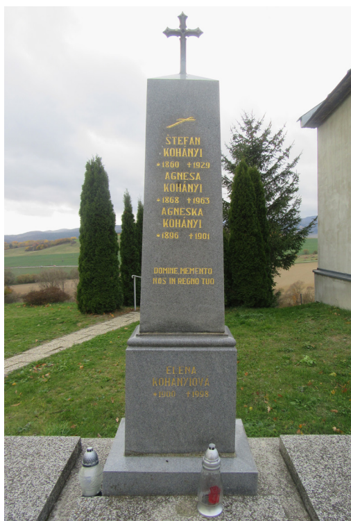
Tročany – miesto posledného odpočinku príslušníkov rodiny Kohányi.