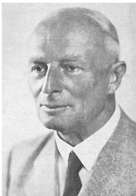
Václav Girsu (1875 – 1954)