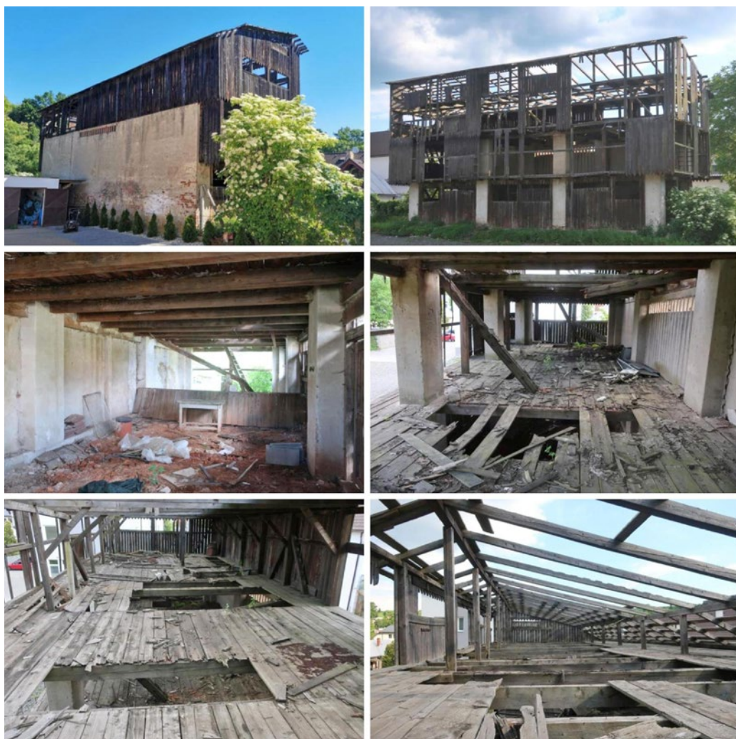
Obrázok 4 Interiér a exteriér objektu NKP Sušiareň (liečivých rastlín) v Hanušovciach nad Topľou (veľká sušiareň) – aktuálny stav (jún 2021).

plytkou asymetrickou trojnásobne zalomenou strechou, osadenou na betónových základoch. Nosnú konštrukciu objektu tvorí dvojpodlažný murovaný skelet, pozostávajúci z ôsmich tehlových omietaných (vápenná biela šúchaná) pilierov z plných pálených tehál spájaných maltou a štvorpodlažná drevená hrádzená stĺpková konštrukcia bez výplne z pílených hranolov spájaných čapovaním a klincovaním, zavretá jedno a dvojstrannými pásikmi a horizontálnymi rozperami.