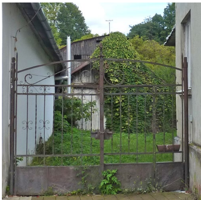
Obrázok 10 Vstupná brána do areálu sušiarne v Hanušovciach nad Topľou (rok 2013).

Do areálu sušiarne sa vstupovalo z Komenského ulice, prostredníctvom vstupnej brány, umiestnenej prostredníctvom kovových závesov na kovových stĺpoch osade-