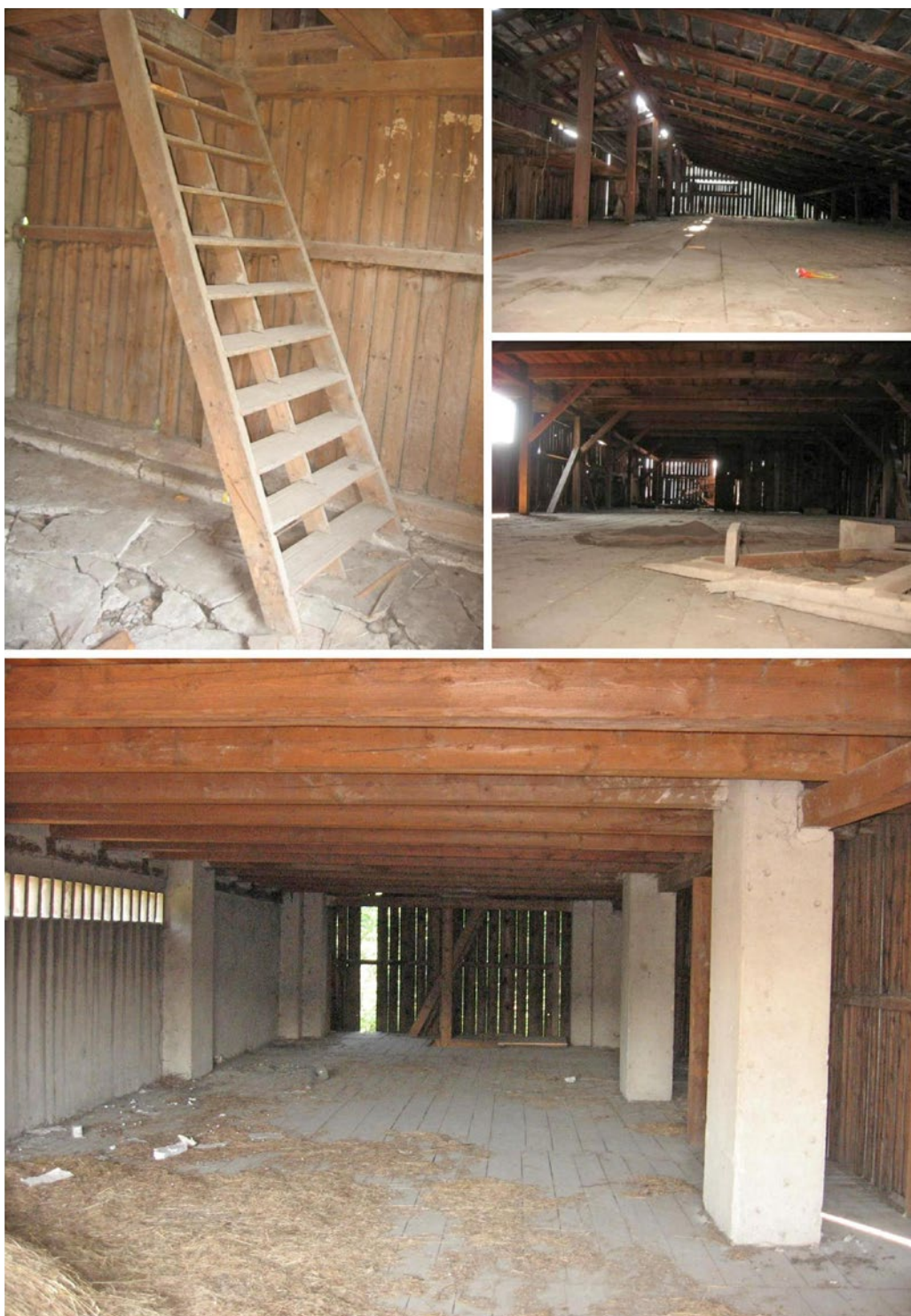
Obrázok 4 Interiér objektu NKP Sušiareň (liečivých rastlín) v Hanušovciach nad Topľou (veľká sušiareň) – stav v roku 2008. Zdroj: Archív KPÚ Prešov, Hanušovce nad Topľou, 09/2008. Autor fotografie: M. Kaliňák