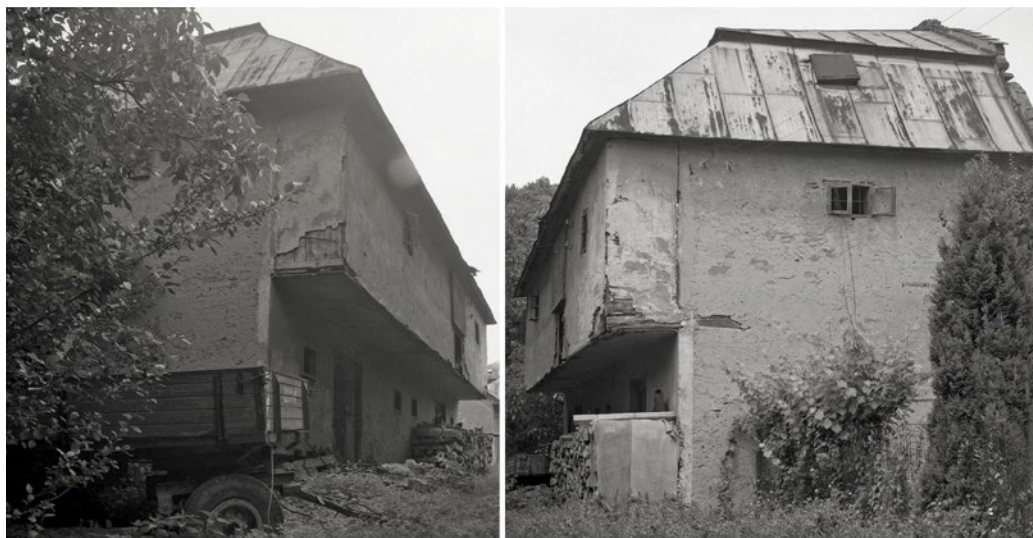
Obrázok 5 Objekt malej sušiarne v areáli sušiarne v Hanušovciach nad Topľou (rok 1992).

menného kríža. Drevená omietaná pavlač bola na južnej a severnej strane hlavnej fasády perforovaná pravouhlými okennými otvormi, ktoré vyplňali dvojkrídlové von otvárané dvojtabuľové presklené výplne. V strede pavlače boli nad sebou, v celej jej výške, situované dva veľké pravouhlé otvory, z ktorých horný bol vyplnený jednoduchou doskovou jednokrídlovou otváranou výplňou a spodný bol bez výplne. Pokiaľ ide o interiéru, prízemie, ktoré slúžilo primárne na uskladnenie bylín, bolo dvojpriestorové a malo hlinenú podlahu a drevený trámový strop a poschodie, ktoré slúžilo na sušenie rastlín, bolo jednopriestorové, malo drevenú podlahu a drevený strop omietaný na rákos.