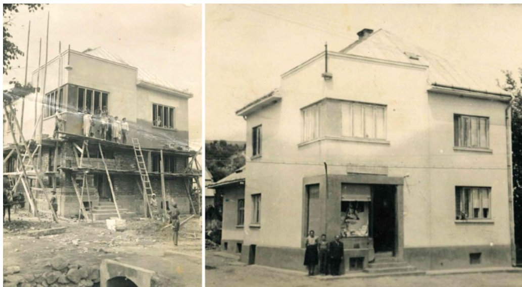
Obrázok 6 Funkcionalistická vila (vľavo v čase výstavby, vpravo v 60. rokoch 20. stor.) v areáli sušiarne v Hanušovciach nad Topľou.