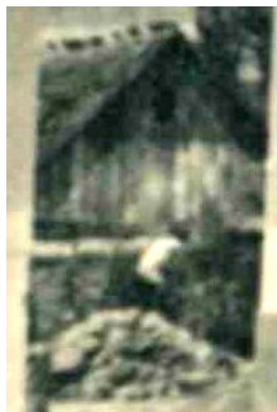
Obrázok 9 Východná maštaľ v Hanušovciach nad Topľou (60. roky 20. stor.).

„Východná“ maštaľ, situovaná medzi malou sušiarňou a funkcionalistickou vilou s rodinným domom, predstavovala murovaný neomietaný