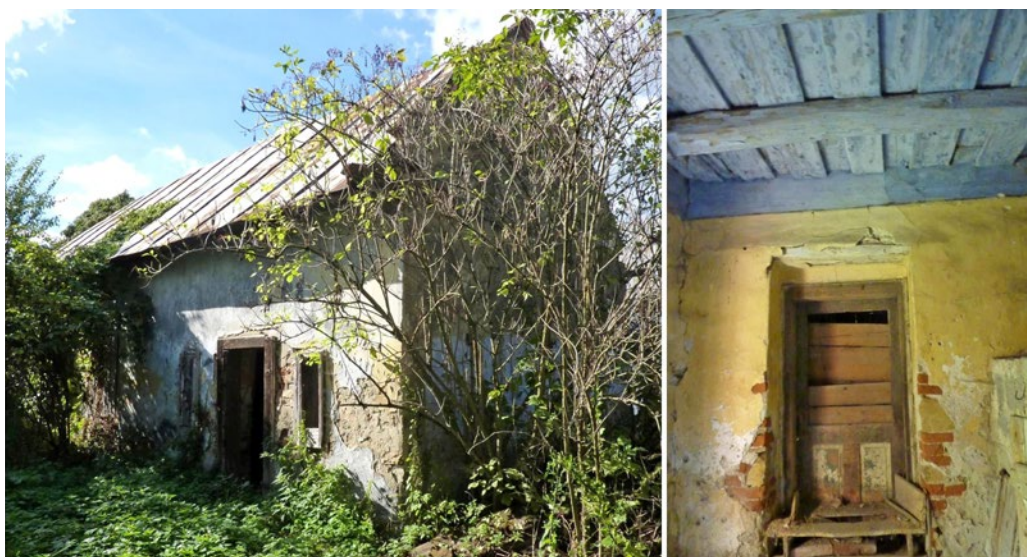
Obrázok 8 Interiér a exteriér objektu „západnej“ maštale v areáli sušiarne v Hanušovciach nad Topľou (rok 1993). Archív KPÚ Prešov, Hanušovce nad Topľou, 09/2013. Autorka fotografií: J. Onufráková

bola pozinkovaným plechom so stojatou drážkou strihaným a ukladaným do pásov. Z južnej strany ku nej bola pristavaná drevená dosková stavba šírky asi 1 m, zo severnej strany sa na ňu napájala drevená kôľňa. Exteriér objektu bol opatrený povrchovým náterom svetlomodrej farby, interiér náterom v žltom, resp. okrovom odtieni. Vstup do maštale bol situovaný v severnej časti jej hlavnej (dvorovej, východnej) fasády. Išlo o pravouhlý dverný otvor, ktorý vyplňala jednoduchá drevená zárubňa a jednokrídlová dnu otváraná plná drevená rámová výplň s krabicovým zámkom a kovovou kľučkou. Severne a južne od vstupného otvoru sa nachádzali dva pravouhlé vetracie otvory bez výplní. Objekt bol dvojpriestorový, pričom do druhého (južného) priestoru sa vstupovalo z interiéru, prostredníctvom pravouhlého dverného otvoru, situovaného uprostred južného múru severnej miestnosti. Otvor vyplňala jednoduchá drevená zárubňa a jednokrídlová dnu otváraná plná drevená rámová dverná výplň s krabicovým zámkom a kovovou kľučkou. Podlaha bola v maštali hlinená (z udusanej hliny), strop bol drevený trámový s drevným záklopom a povrchovou úpravou modrej farby.