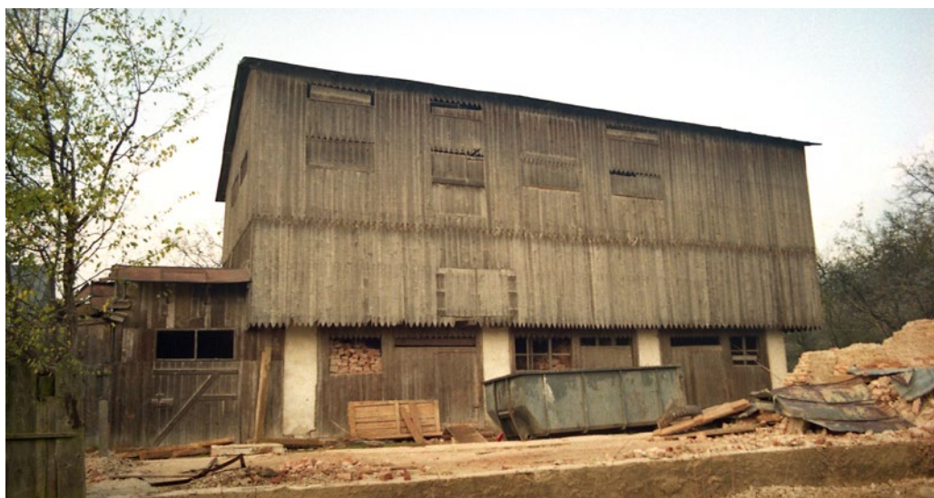
Obrázok 3 Exteriér objektu NKP Sušiareň (liečivých rastlín) v Hanušovciach nad Topľou (veľká sušiareň) – stav v roku 1996.

NKP Sušiareň (liečivých rastlín) v Hanušovciach nad Topľou, vybudovaná v roku 1938, predstavuje nepodpivničenú štvorpodlažnú stavbu obdĺžnikového pôdorysu (17,9 x 6,2 m) zmiešanej tehlovo-drevenej konštrukcie, vysokú asi 9,2 m, ukončenú