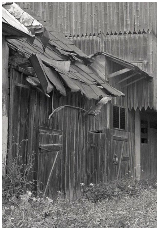
Obrázok 7 Objekt kôlne v areáli sušiarne v Hanušovciach nad Topľou (rok 1992).

Kôlna, situovaná medzi veľkou sušiarňou a „západnou“ mašťalou, predstavovala jednoduchú drevenú stavbu, ktorej nosnú konštrukciu tvorili pílené hranoly z mäkkého dreva. Obvodový plášť objektu pozostával z drevených dosák, strecha bola pultová, v severnej časti klopená na západ (z dvora) s malým pultom na východe, v južnej časti klopená na východ (do dvora), krytá pozinkovaným plechom so stojatou drážkou strihaným a ukladaným do pásov. Zo severu sa plynule napájala na budovu veľkej sušiarne, z juhu na budovu „západnej“ maštale. Vstupy do kôlne boli situované na východnej strane. Južný a prostredný vstup vypĺňali jednoduché plné drevené doskové von otvárané zvlakové vráta, severný vstup jednoduché plné drevené doskové von otvárané zvlakové vráta s pevným dreveným pravouhlým nadsvetlíkom. Pravouhlý otvor nadsvetlíka bol rozdelený priečnikom na dva